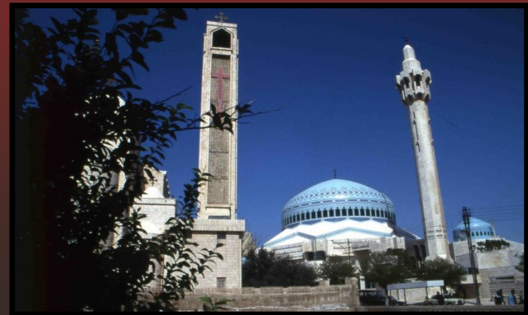
Église et mosquée, 'Ammān (Jordanie)