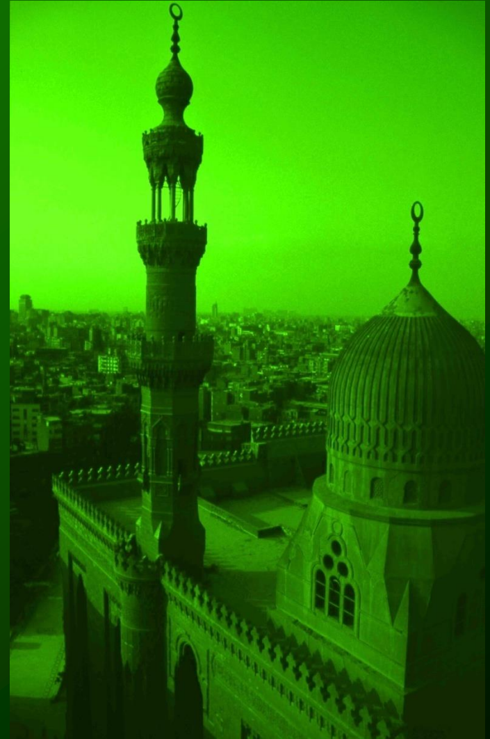
Mosquée de Sultan Hasan, le Caire