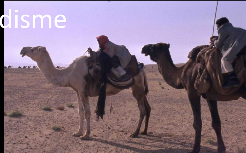
région de Sukhne (Syrie), 2002