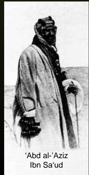
'Abd al-'Aziz Ibn Sa'ud