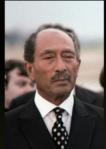
Sadat (m. 1981)