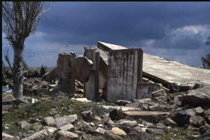
Qunaytra (Golan syrien), détruit en 1974