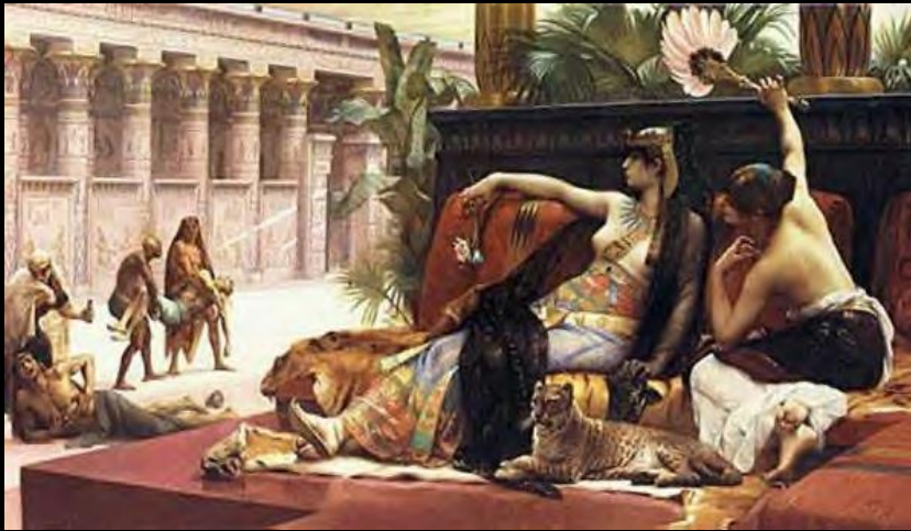
Cléopâtre essayant des poisons sur des condamnés à mort, Alx. Cabanel, 1887 ; Bain maure, J.-L. Gérôme, 1870 ; Charge de la cavalerie exécutée par le général Murat à la bataille d'Aboukir (23 juillet 1799), baron A.-J. Gros, 1806.